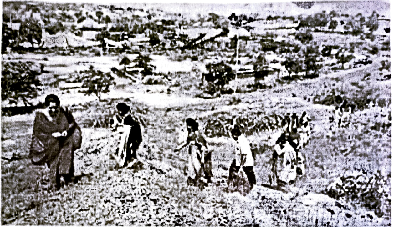
कलियाणा में अरावली की पहाड़ी को दौरा करते जनता कॉलेज के विद्यार्थी।